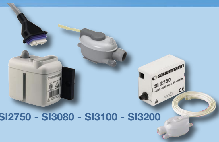
SI2750 - SI3080 - SI3100 - SI3200