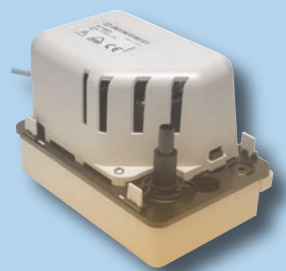
SI1805 - SI1820