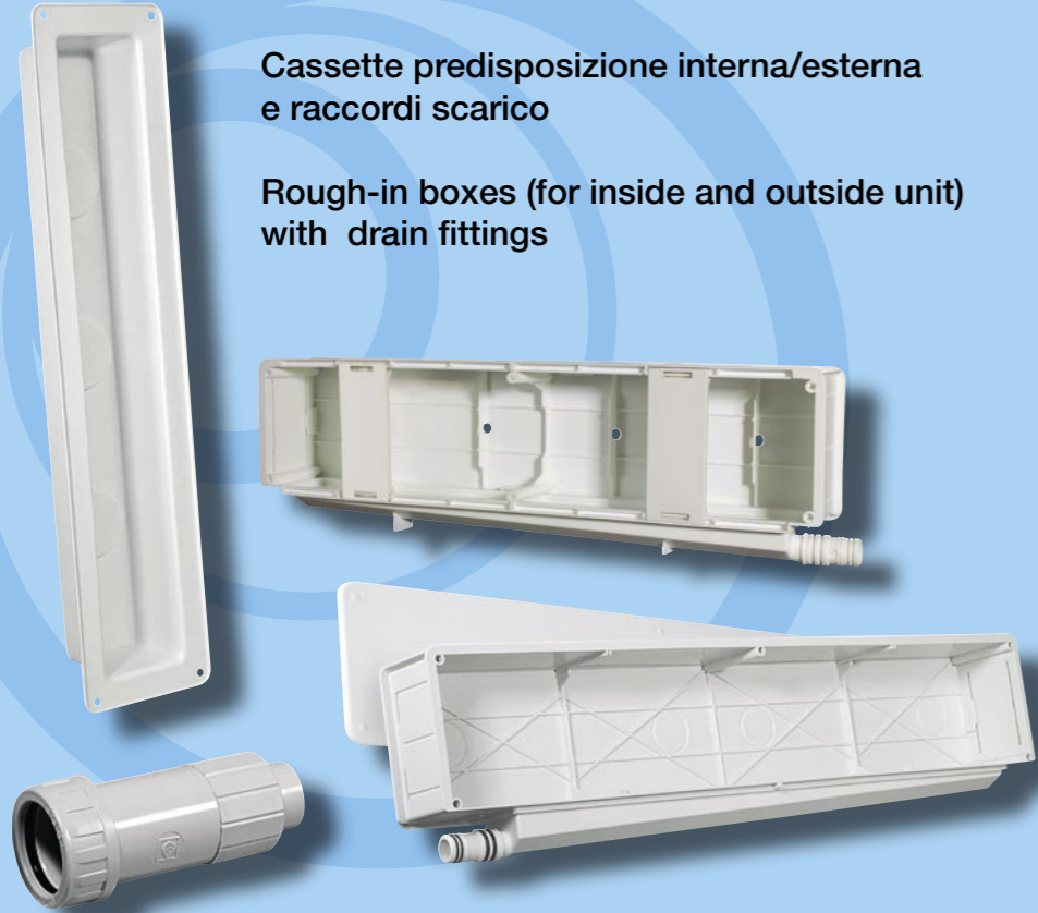
Cassette predisposizione interna/esterna e raccordi scarico Rough-in boxes (for inside and outside unit) with drain fittings