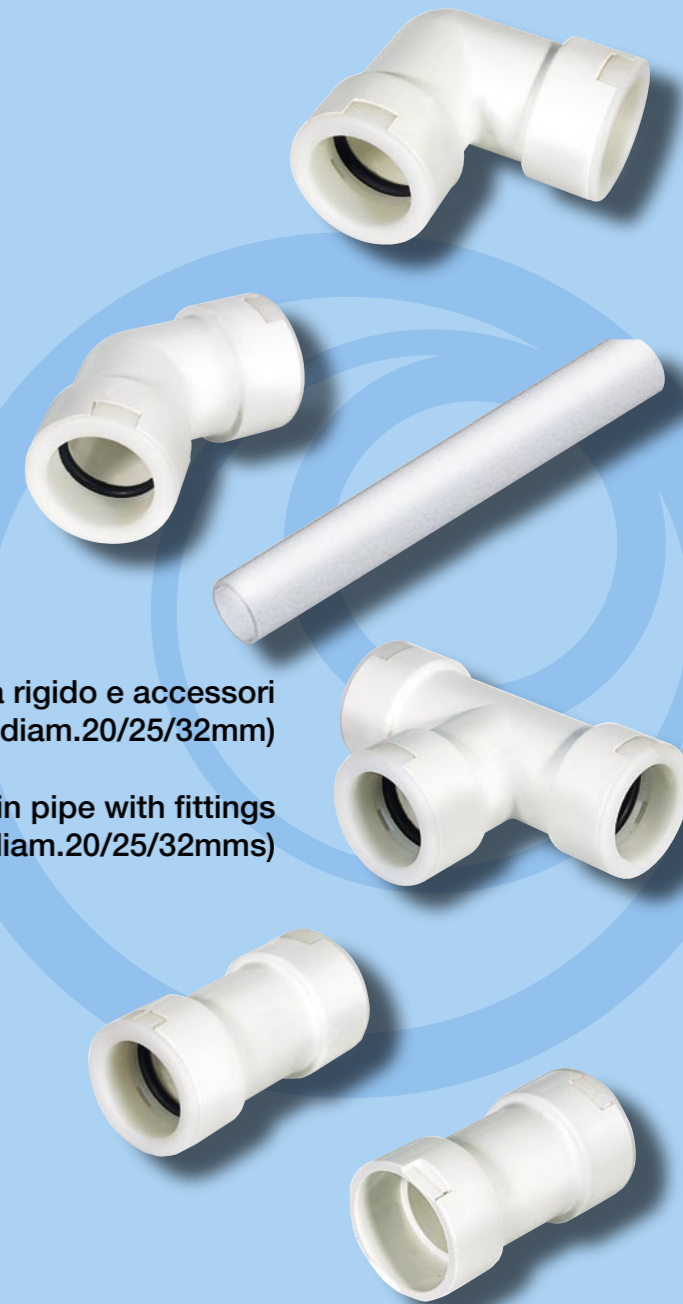
Tubo scarico condensa rigido e accessori (diam.20/25/32mm) Rigid condensate drain pipe with fittings (diam.20/25/32mms)