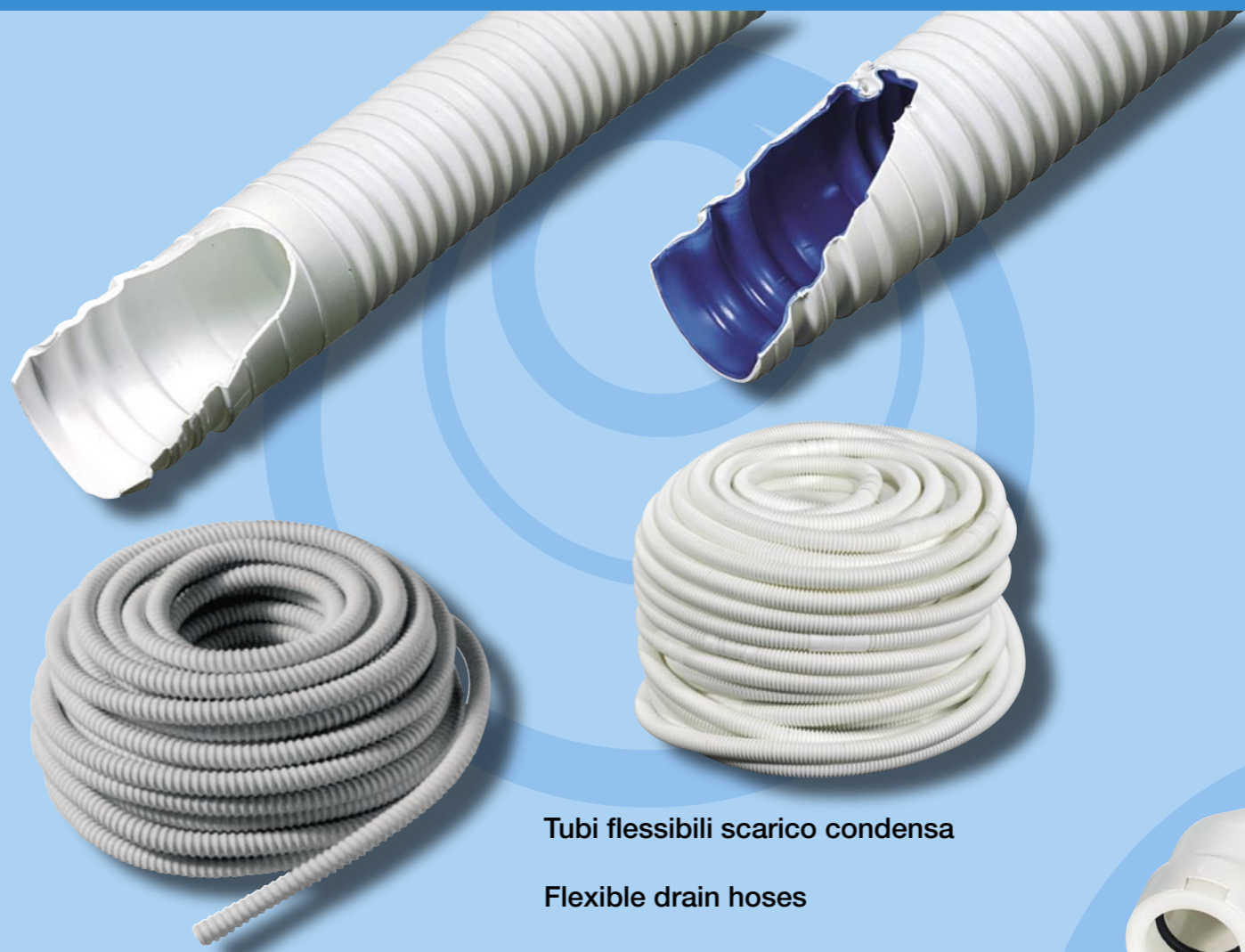
Tubi flessibili scarico condensa Flexible drain hoses