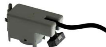
Pompa senza vaschetta